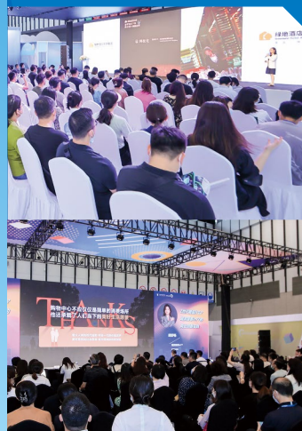
上海新国际博览中心

CCE 全国巡回研讨会自 2002 年起，已开展 20 余年 ，走过全国 29 个城市 与地区，覆盖华东、华北、华南、西南、西北等等。CCE 全国巡回研讨会作为上海国际清洁技术与设备博览会的延伸活动，目前已在 成都 等地顺利举办，未来 CCE 将走向全国更多城市，为推动清洁行业升级，促进经济内循环贡献平台力量。